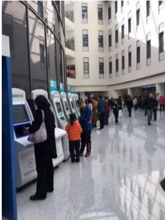
Abbildung 2: Transaktions-Terminals für Patientinnen und Patienten im Eingangsbereich Tiantan Krankenhaus