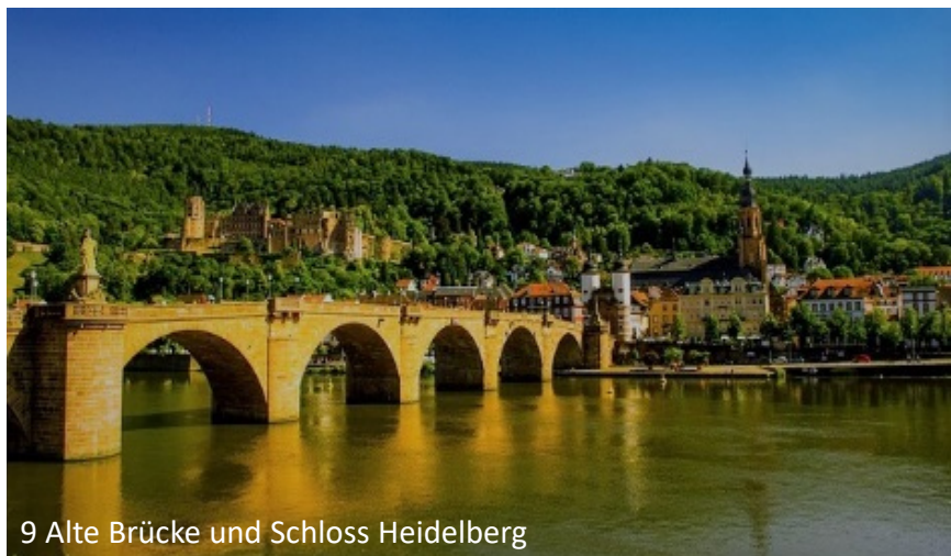
9 Alte Brücke und Schloss Heidelberg