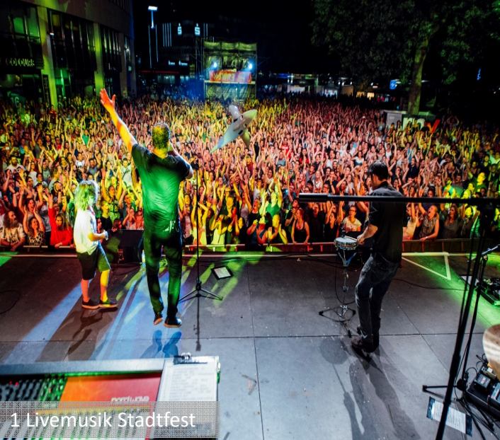
1 Livemusik Stadtfest