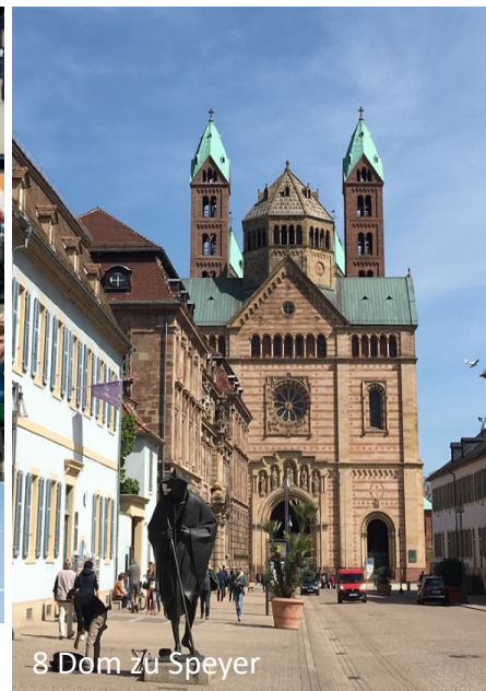
8 Dom zu Speyer