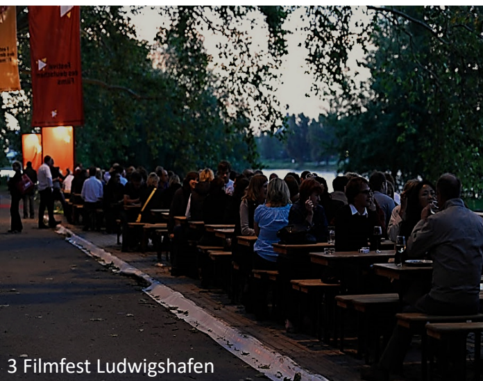
3 Filmfest Ludwigshafen