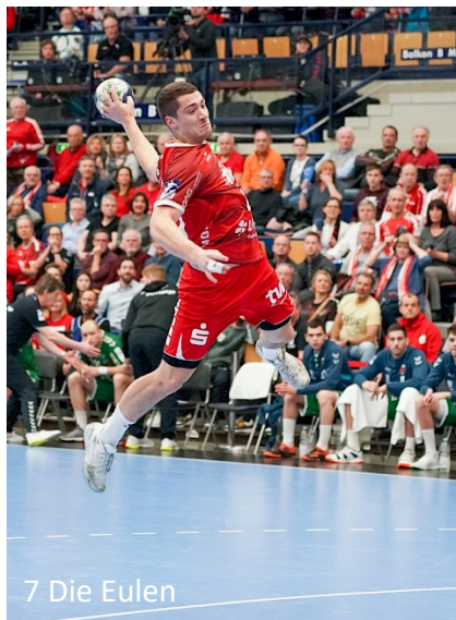
7 Die Eulen